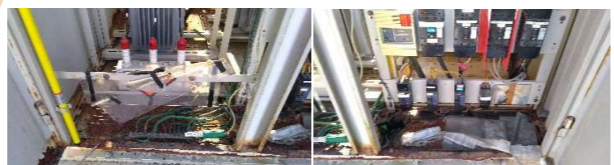
北面左下補修前 北面右下補修前