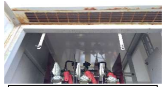
北面上部左補修前