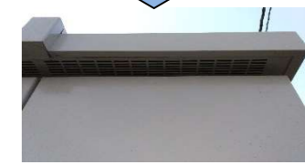
南面上部右補修後