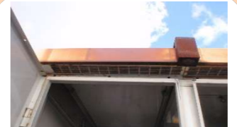
南面上部左補修前