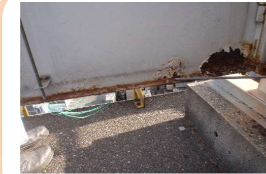
北左扉下部補修前