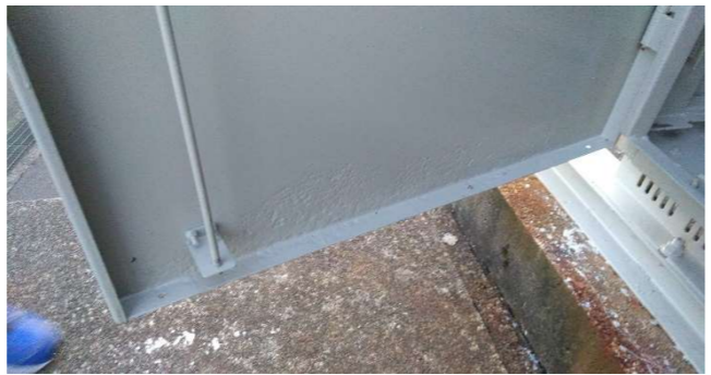
北左扉下部補修後