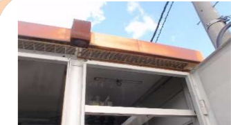
南面上部右補修前