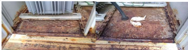
南面左下補修前 南面右下補修前