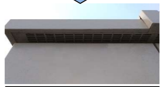
南面上部左補修後