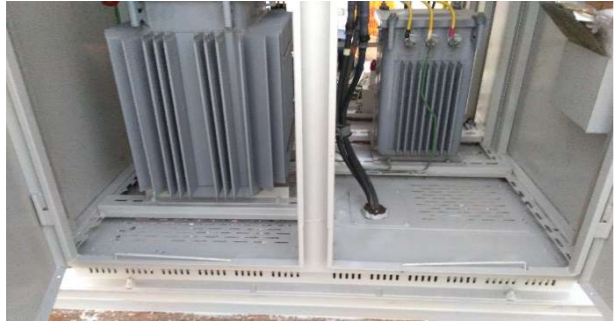
南面下部錆取り塗装後