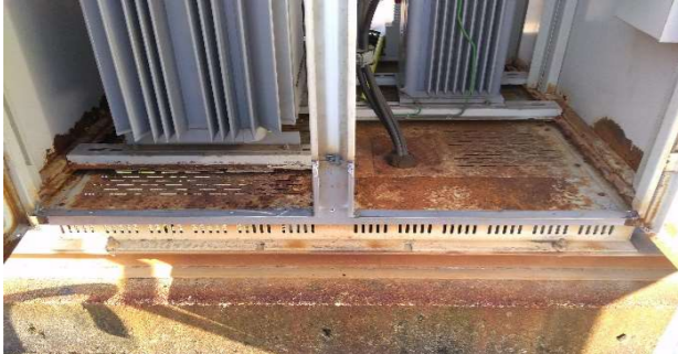
南面下部板金熔接補修後