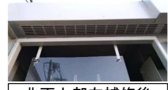
北面上部左補修後