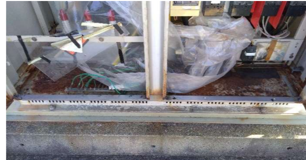
北面下部板金熔接補修後