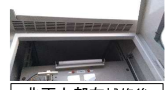
北面上部右補修後