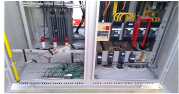
北面下部錆取り塗装後