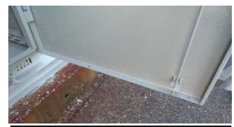
南右扉下部補修後