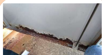
南右扉下部補修前